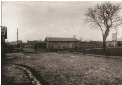
Le camp des Alliers à Angoulême

Les autres membres du convoi reprennent le chemin en sens inverse et seront livrés au régime Franquiste en gare d'Irun.