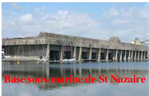
Base sous-marine de St Nazaire

L'organisation TODT était un groupe de génie civil et militaire qui construisit pour l'Allemagne Nazie des usines d'armement, des bases de sous-marins et des lignes de fortification comme le mur de l'Atlantique.